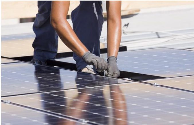
Montage Solarzellen

Weitere Informationen finden Sie unter https://www.baywa.com/presse/auf-einen-blick . Druckfähige Pressefotos, Footage-Material und Videostatements finden Sie hier . Die BayWa AG auf Twitter: https://twitter.com/BayWaPresse